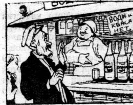
...а в тени только 40°!!