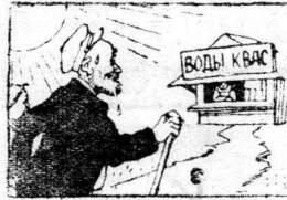
на солнце 20°...