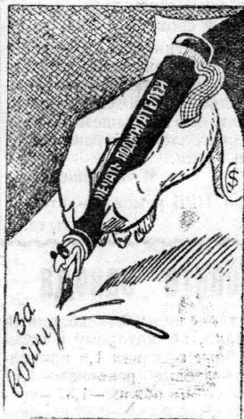
Почерк Уолл-стрита Рисунок А. Зубова.

Принято также решение регулярно издавать газету «Общество защиты мира».