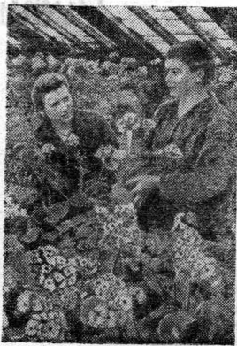
Москва. В оранжеере перво-

Ценный почин жильцов дома № 6 по улице Тракторной должен быть подхвачен всеми жильцами поселка. Жилищно-коммунальному отделу завода необходимо поддержать ценную инициативу жильцов и оказывать им всемирную помощь в получении посадочных материалов и строительстве необходимых оград.