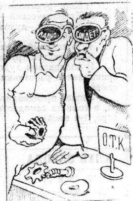
Бракодел и браковщик иногда видят одинаково. Рис. А. Зубова.