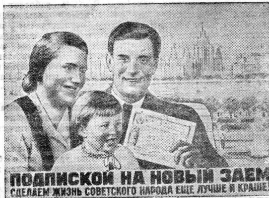
ПОДПИСКОЙ НА НОВЫЙ ЗАЕМ СДЕЛАЕМ ЖИЗНЬ СОВЕТСКОГО НАРОДА ЕЩЕ ЛУЧШЕ И КРАШЕ!