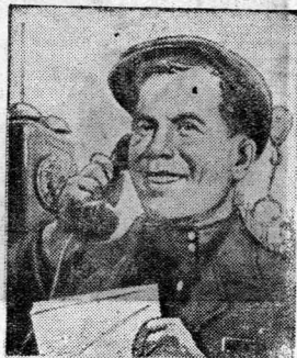
МЫ ВСЕ, КАК ОДИН ПОДПИСАЛИСЬ НА ЗАЕМ

Под руководством партии Ленина — Сталина большевистская печать ведет борьбу за победу коммунизма в нашей стране.