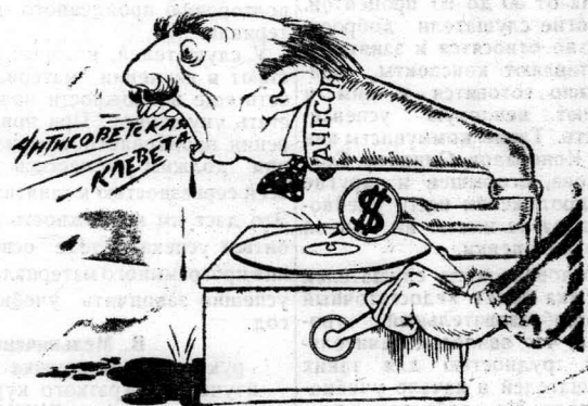
— Заигранная пластинка.

Влияние хрома и бора на графитизацию белого чугуна. ИТЭИН. Периодическая информация № 1498, М — 1950 г. Стр. 2.