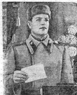
ГОЛОСУЮ ЗА МОЩЬ СОВЕТСКОЙ РОДИНЫ!

Одержав великую историческую победу над гитлеровской Германией, советский народ успешно восстанавливает и развивает народное хозяйство страны. Вооруженные Силы СССР стоят на страже мира. И как бы ни бесновались англо-американские поджигатели новой войны, ничто не поколеблет силы социалистического государства. Верным стражем безопасности нашей Родины, надежным оплотом мира во всем мире являются Вооруженные Силы Советского Союза.