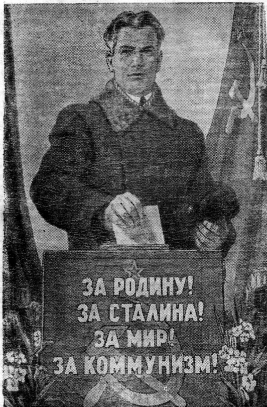
Плакат выпущенный издательством «Искусство».

Коллективный договор должен создаваться при непосредственном участии широких масс рабочих и служащих. В коллективном договоре выражена конкретная программа работы хозяйственных и профсоюзных организаций на год. За нее будут бороться все рабочие и служащие завода и, чем активнее будет эта борьба, тем эффективнее будут наши производственные победы, тем выше будет благосостояние трудящихся нашего завода.