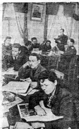
Молдавская ССР. На агитпункте 7-го избирательного участка Кишинева.