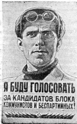
Плакат выпущенный издательством «Искусство».