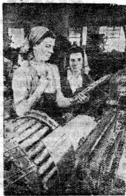
Румыния. Бухарестская хлопчатобумажная фабрика «Индустрия Бумбакулуй» — одно из передовых текстильных предприятий Румынии. С начала года фабрика выработала сверх плана тысячи метров тканей.

В читальном зале библиотеки оборудованы фотовитрина и выставка произведений А. П. Чехова.