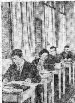
Банк. В парткабинете завода имени Сталина.