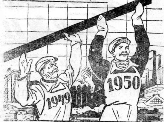
ПОДЫМАЙ ЕЩЕ ВЫШЕ!