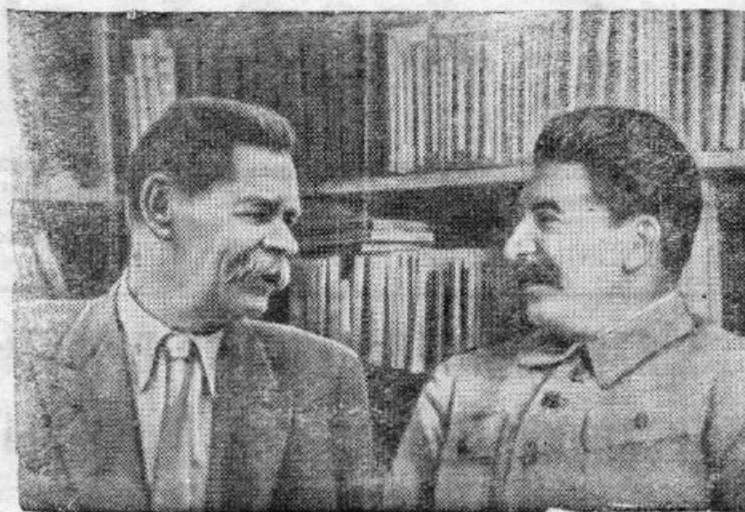
И. В. Сталин и А. М. Горький.