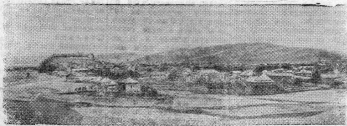
Общий вид г. Гори — родины И. В. Сталина.