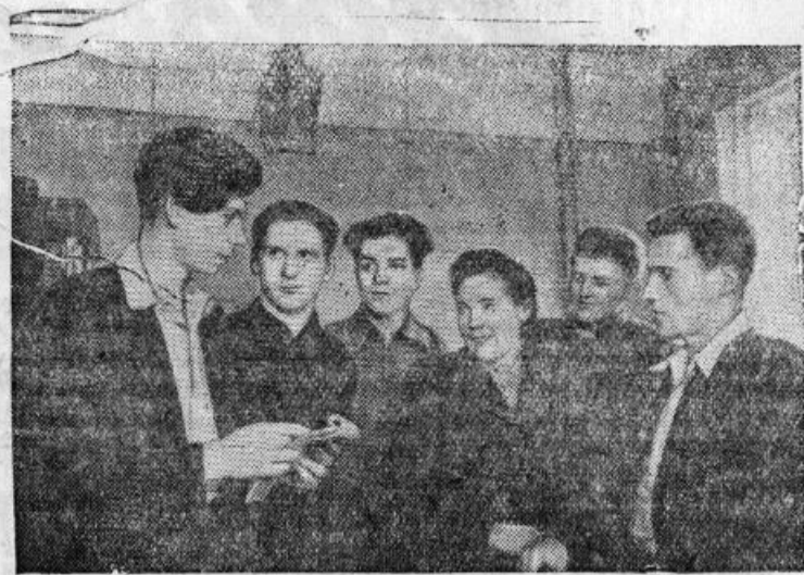
Московский завод «Геофизика» выполнил пятилетний план. За семь месяцев этого года завод изготавил аппаратуры для нефтяной промышленности в 2,8 раза больше, чем за весь 1946 год — первый год пятилетки.

старший мастер участка сложного инструмента инструментального цеха.