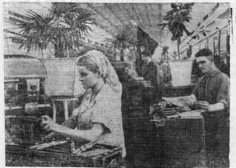
Сталинград. Инструментальный цех тракторного завода с каждым днем все более благоустраивается. В цехе поставлены цветы и пальмы.