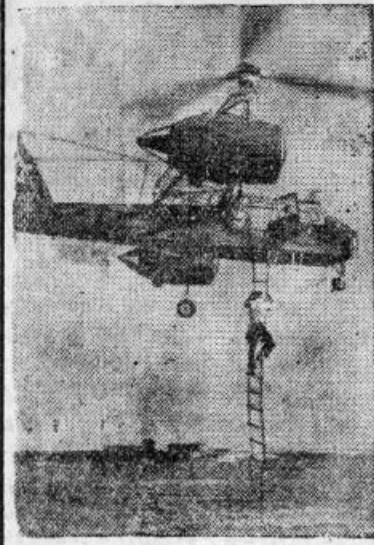
На снимке: геликоптер инженера Братухина, находясь в воздухе, высаживает пассажира.