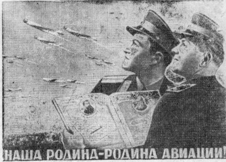
НАША РОДИНА-РОДИНА АВИАЦИИ!

Плакат работы художников В. Корецкого и В. Гиневич, выпускаемый издательством «Искусство».