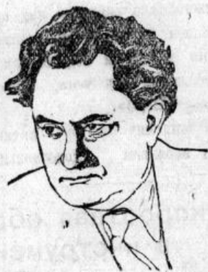
Комитета Болгарской коммунистической партии, наш товарищ и брат Георгий Михайлович Димитров.

Центральный Комитет Всесоюзной Коммунистической партии (большевиков) и Совет Министров Союза ССР с глубоким прискорбием извещают, что 2 июля в 9 часов 35 минут, после продолжительной и тяжелой болезни (печень, диабет) в санатории «Барвиха» близ Москвы, скончался выдающийся деятель международного рабочего движения, Председатель Совета Министров Болгарской народной демократической республики, Генеральный секретарь Центрального