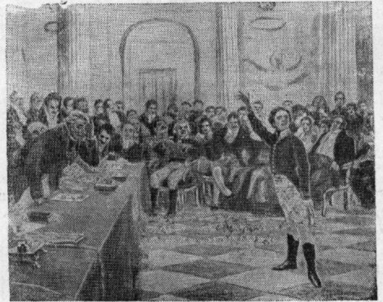
На переводных экзаменах в лицее А. Пушкина читает свое стихотворение «Воспоминания о Царском Селе» в присутствии поэта Державина.

(Из патриотической оды «Воспоминания в Царском Селе», 1814 г.)