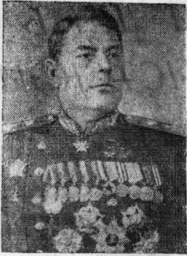
★ Министр Вооруженных Сил СССР Маршал Советского Союза А. М. Василевский ★