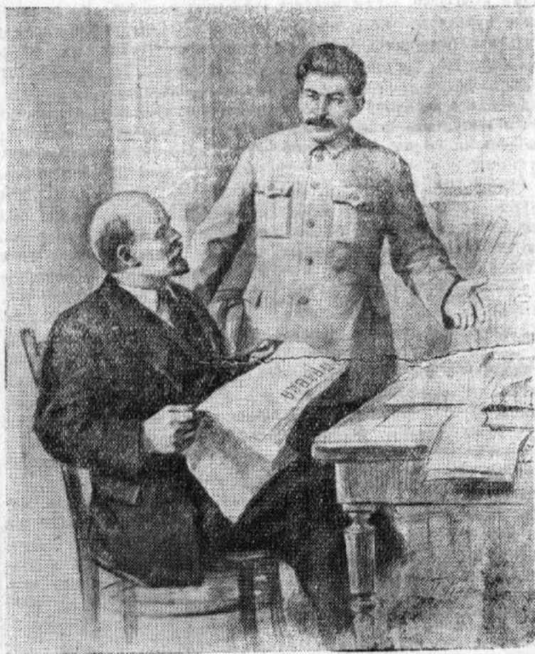
В. И. Ленин и И. В. Сталин.

Критика и самокритика — могучая движущая сила развития советского общества. Без нее немислима успешная работа советских газет. Все наши рабкору, селькору, все активисты предприятий, колхозов, совхозов и учреждений должны шире использовать пе-