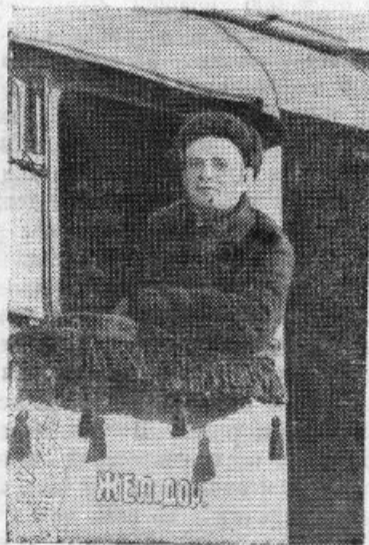
Томская железная дорога.

секретарь комсомольской организации прессового цеха.