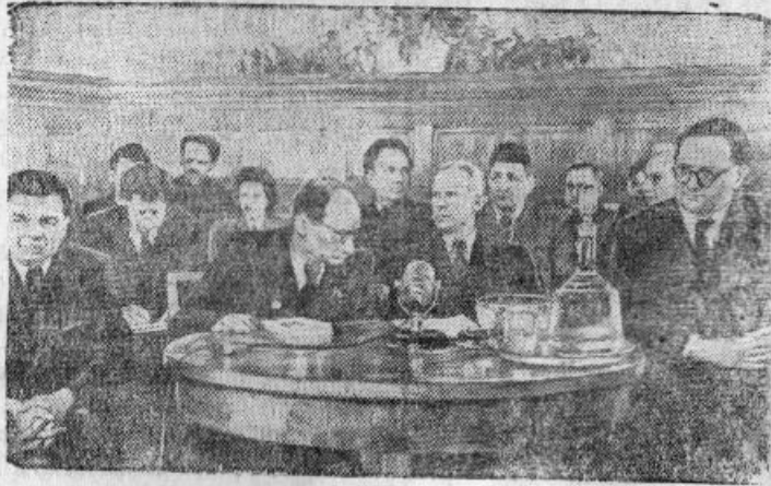
Москва. Денеда белорусской литературы в Центральном Доме литераторов.