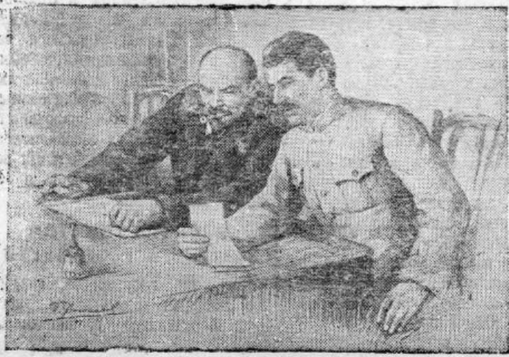
В. И. Ленин и И. В. Сталин.

Героический советский народ, ведомый славной большевистской партией, уверенно прокладывает путь к коммунизму. Всеми своими победами, всеми успехами за эти 25 лет мы обязаны нашему вождю, учителю и отцу товарищу Сталину, который свято выполняет заветы Ленина. Подаром в народе говорят, что Сталин — это Ленин сегодня. Ленин живет в делах Сталина!