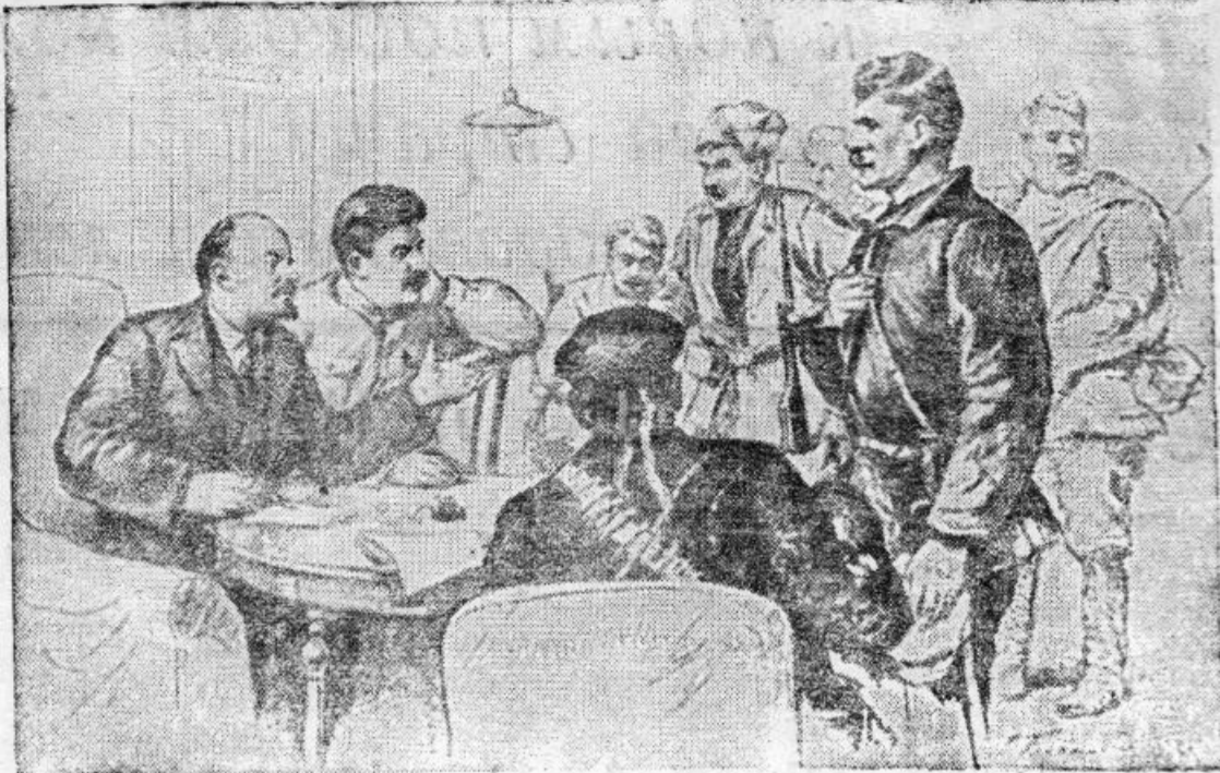
В. И. Ленин и И. В. Сталин с красногвардейцами в Смольском (1917 год).

Не миллионами, а десятками миллиардов рублей исчисляются теперь капитальные вложения в промышленность. По послевоенному сталинскому пятилетнему плану мы должны восстановить, построить и ввести в действие около 5.900 крупных государственных предприятий. На капитальные вло-