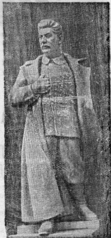
Москва. Центральный музей В. И. Ленина. На снимке: Иосиф Виссарионович Сталин. Моумент работы Меркурова.

Ныне Всесоюзная коммунистическая партия большевиков, насчитывающая более шести миллионов бойцов, является самой могущественной, самой влиятельной политической партией в мире. Ее растили и обучали Ленин и Сталин. Ее