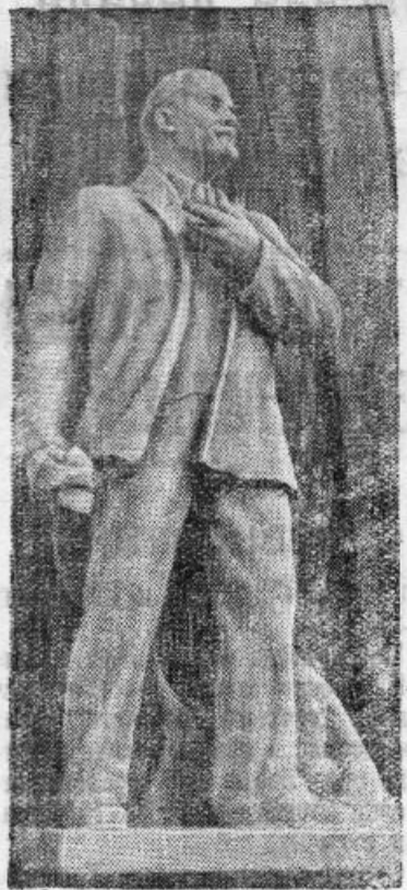
Москва. Центральный музей В. И. Ленина. На снимке: Владимир Ильич Ленин. Скульптура работы Меркурова.