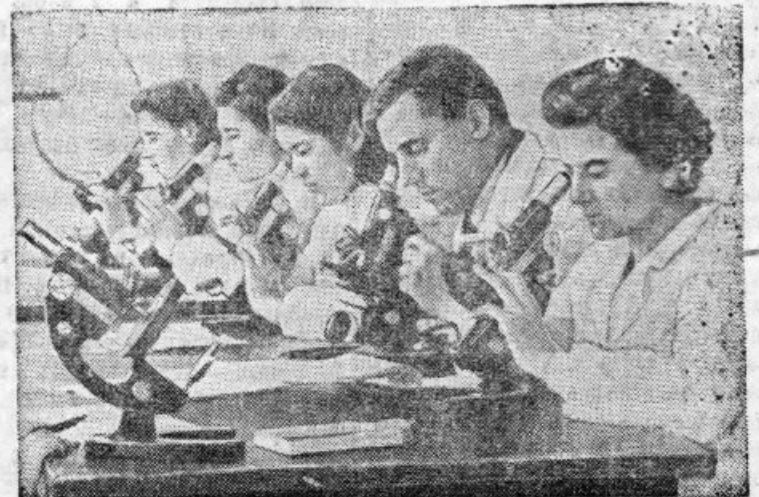
В Советской Белоруссии 11.719 школ, в которых обучаются свыше 1 миллиона 400 тысяч детей, 26 институтов, государственный университет, Академия наук и десятки научно-исследовательских институтов.

На снимке: в Минском медицинском институте.