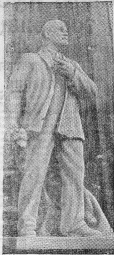
Москва. Центральный музей В. И. Ленина. На снимке: Владимир Ильич Ленин. Скульптура работы Меркурова.