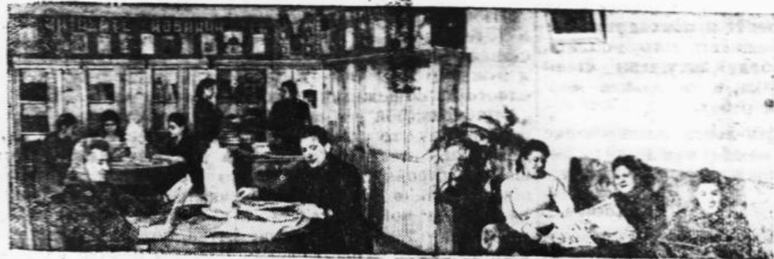
Сталинград. При обкоме профсоюза работников связи открылась библиотека. В библиотеке имеются новинки технической литературы, в частности, по вопросам радио и телефонной связи. На снимке: в библиотеке связистов.