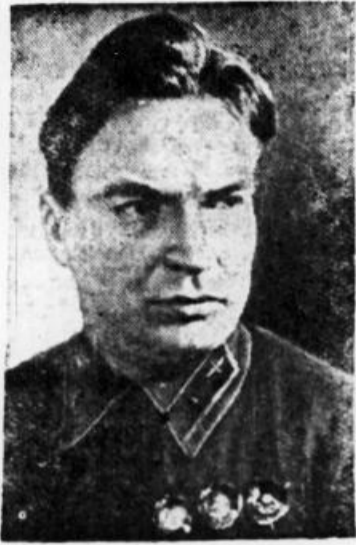
Великий летчик нашего времени Валерий Павлович Чкалов. (К 10 летию со дня гибели—15 декабря 1938 года).

Чкалов страстно ненавидел фашизм, понимал, что фашистские захватчики готовят вооруженное нападение на нашу страну. И всю свою жизнь, до последнего