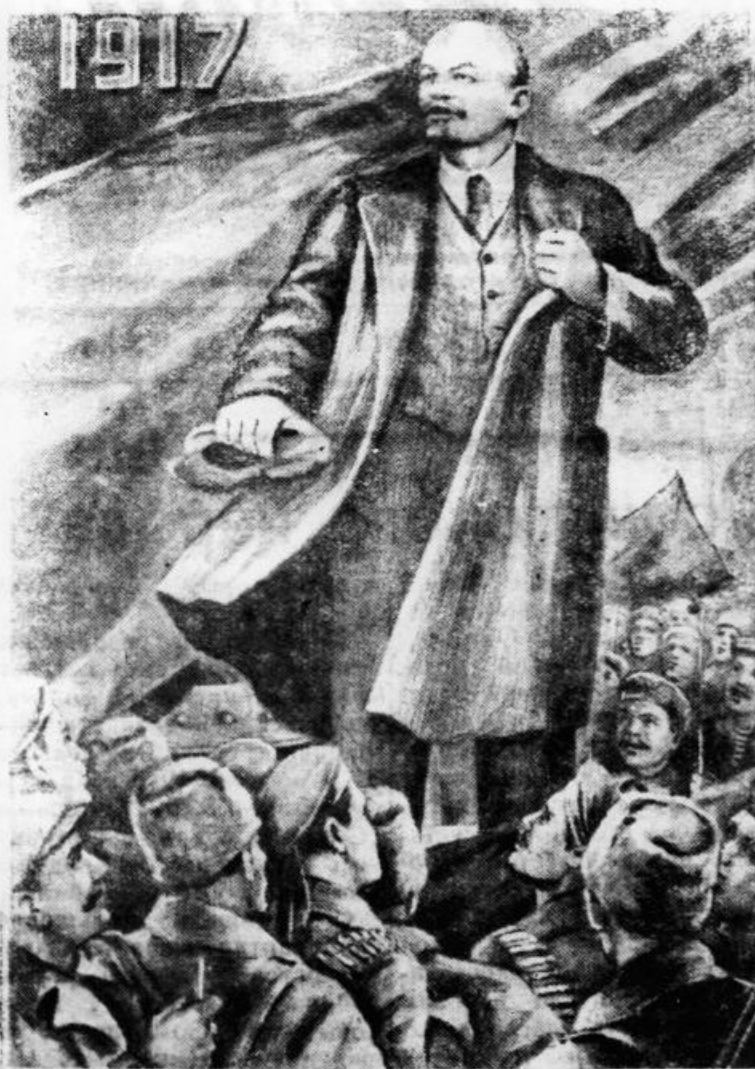
ЛЕНИН ВЕЛИКИЙ НАМ ПУТЬ ПОКАЗАЛ!