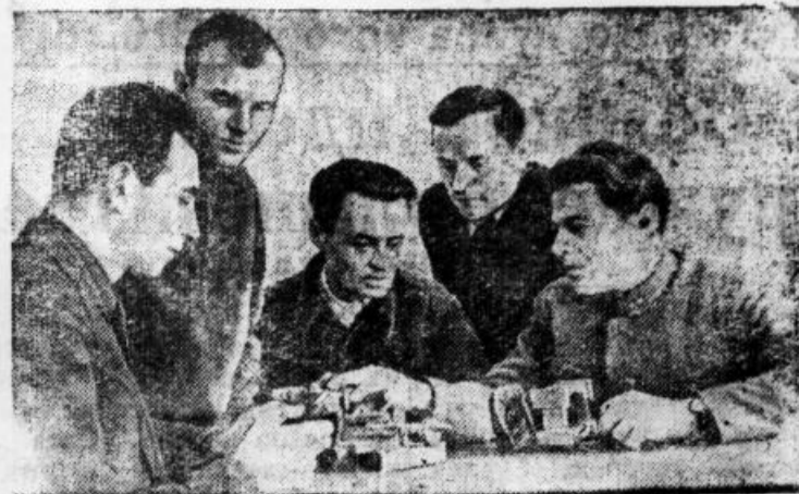
Московский завод «Энергоприбор» Министерства электростанций СССР, получивший в прошлом году более миллиона рублей внепланового накопления, успешно работает и в текущем году.

При закладке новых плодовых насаждений сельскохозяйственные и лесные работники, агрономы, садоводы обязаны учесть все достижения науки и богатый опыт передовиков садоводства.