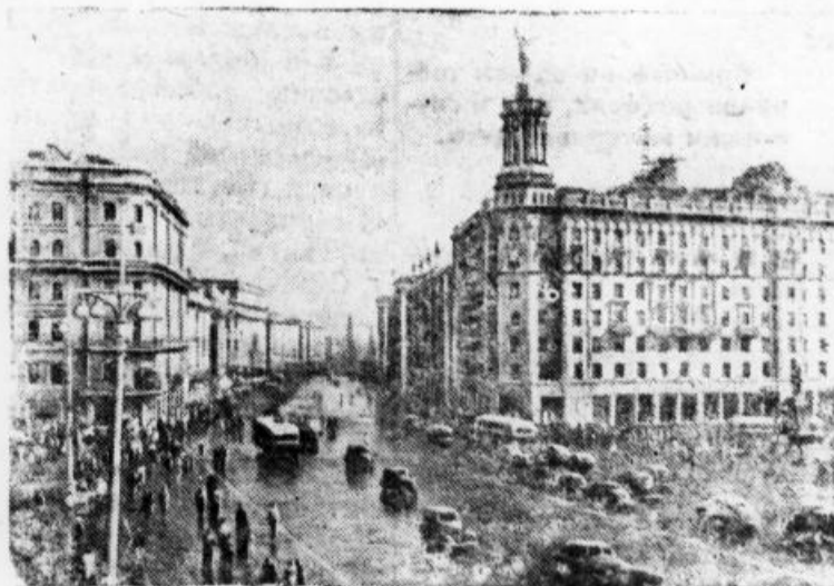
Москва. Улица Горького — центральная магистраль столицы.

Таким образом, магнитный сепаратор, небрежно изготовленный электроремонтниками, ничуть не облегчил работу цеха, а наоборот, усложнил ее, загрузив слесарей отдела механика.