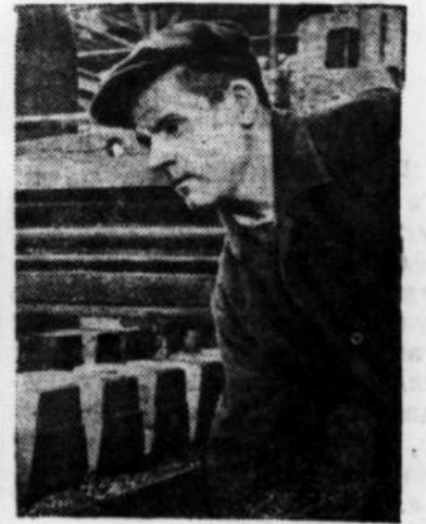
Харьков. 8-й государственный машиностроительный завод в 1948 году в 5 раз увеличил выпуск своей продукции.