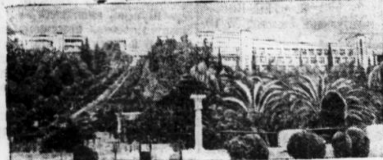
Сочи. Общий вид санатория Министерства Вооруженных сил СССР имени К. Е. Ворошилова.

старший прораб 3-го строительного участка треста «Алтаймашстрой».