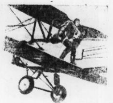
Воздушный спорт в СССР. На снимке: парашютист на крыле самолета перед прыжком.