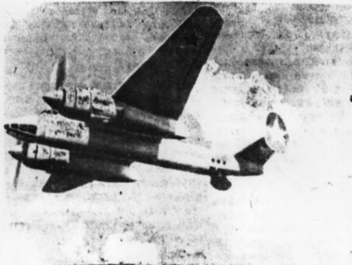
Скоростной бомбардировщик в полете.

Завоевавшие славу и любовь народа в годы войны сталинские соколы оттачивают свое мастерство, высоко держат боевое знамя.