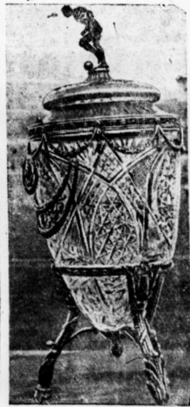
«Кубок СССР» по футболу.