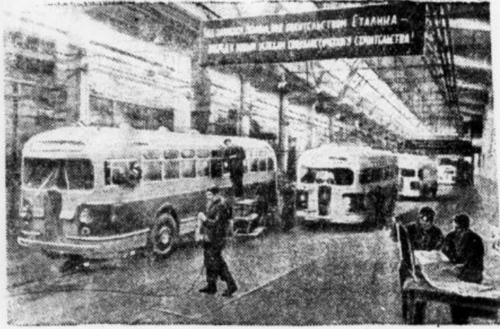
Московский автомобильный завод имени Сталина. На конвейере сборки новых комфортабельных автобусов ЗИС-154.