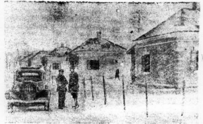
В 1947 году для рабочих Хабаровского завода имени Орджоникидзе построено свыше 20 индивидуальных каменных многоквартирных домов. На строительство этих домов государством была выдана ссуда в размере 12 тысяч рублей каждому застройщику с рассрочкой на 10 лет. На снимке: новые жилые дома.