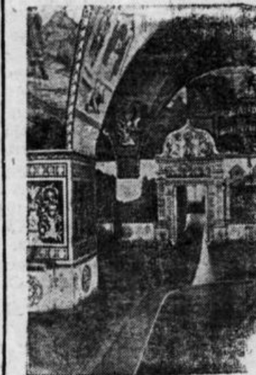
Москва. Большой Кремлевский дворец. Гранатовая палата.