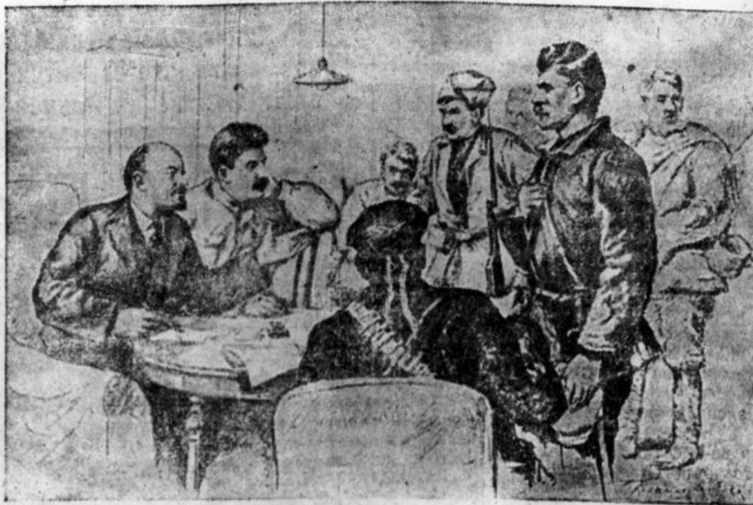
В. И. Ленин и И. В. Сталин с красногвардейцами в Смольном (1917 г.)

Наш советский патриотизм — это орудие строительства и борьбы, орудие организации и мобилизации наших сил для дальнейшего движения вперед. Советский патриотизм — это сознание правильности нашего пути и неизбежности его для трудящихся всего мира. Советский патриотизм — это безграничная уверенность в непобедимости ленинско-сталинских идей, в неизмеримом превосходстве социализма над капитализмом, социалистической культуры над культурой буржуазной. Советский пат-