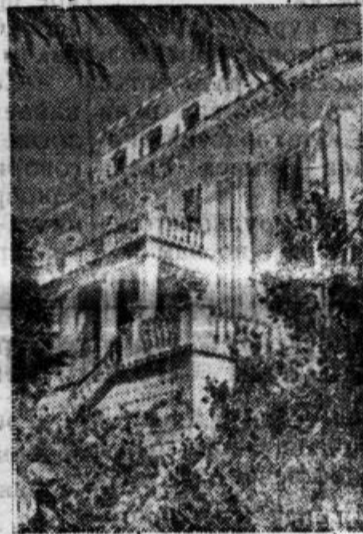
Сочи. Олив из корпусов санатория ВЦСПС.