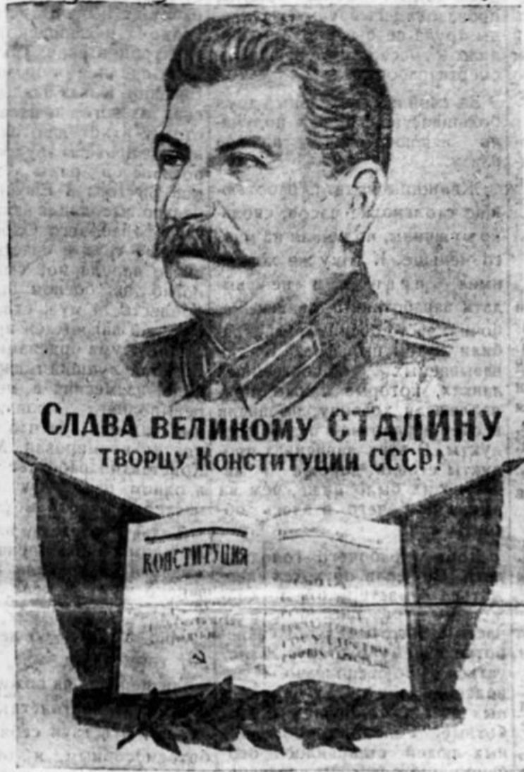
СЛАВА ВЕЛИКОМУ СТАЛИНУ ТВОРЦУ Конституции СССР!