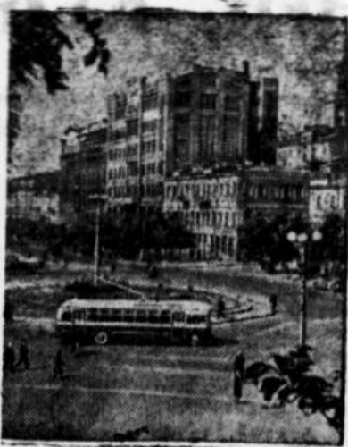
Киев. На площади имени Сталина.