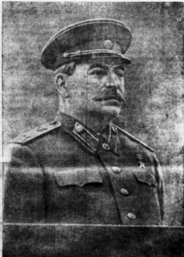
Председатель Совета Министров и Министр Вооруженных Сил Союза ССР Генералиссимус Советского Союза И. В. Сталин.