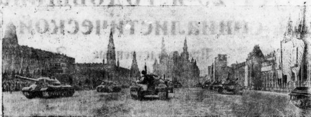
Боевой марш Кантемировской танковой дивизии по Красной площади в Москве. Проходит колонна танков «ИС».