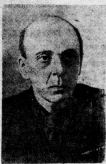
Поэт Павел Григорьевич Антокольский. Ему присуждена Сталинская премия второй степени за поэму "Сын".

БРИЗ завода должно обратить особое внимание на внедрение предложений и установить такой порядок, при котором работы, связанные с реализацией рационализаторских предложений, выполнялись наравне с первоочередными.