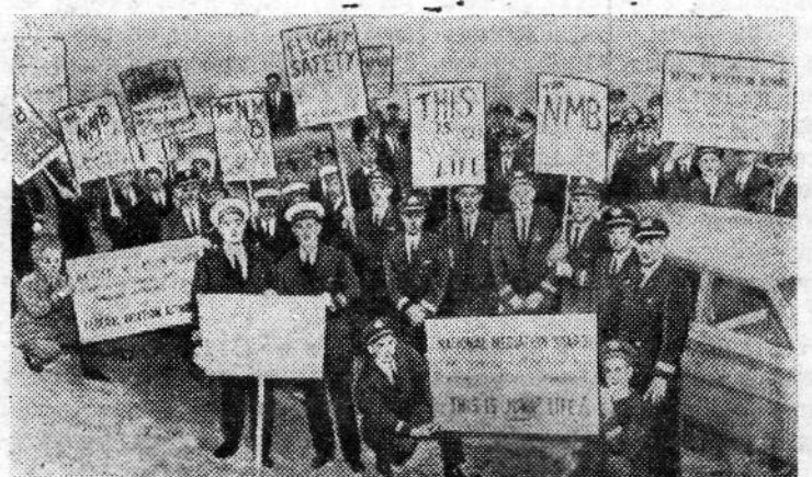
Соединенные Штаты Америки. В штате Калифорния забастовали авиационные инженеры. Они выступают против решений национального управления посредничества, которые в случае их принятия могут лишить инженеров работы. Перед тем как отправиться в Сакраменто для переговоров, бастующие устроили на шоссе демонстрацию. Плакаты в руках бастующих направлены против решений национального управления посредничества.