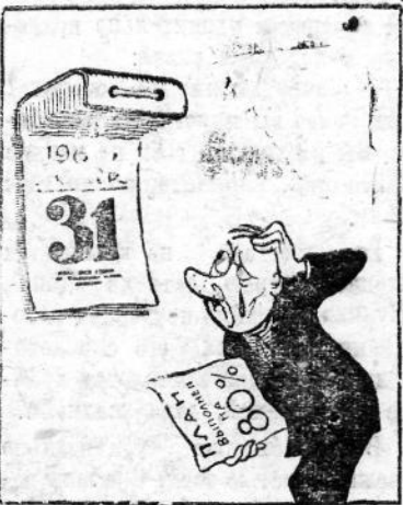
Неуспевалов-Отставалов: — Эх, повернуть бы время вспять, Хотя бы дней на сорок пять! Рис. В. Лыскова.

Отвечая на вопрос одного из корреспондентов, Министр иностранных дел СССР добавил, что он во время встречи с президентом США сообщил ему в устной форме точку зрения Советского правительства и лично его главы Н. С. Хрущева по вопросам, которые являлись предметом обсуждения.