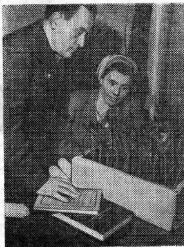
Краснодарский край. Выполняя решения январского Пленума ЦК КПСС, труженники сельского хозяйства Кубани развертывают социалистическое соревнование за

При переводе участков на хозяйственный расчет мы встретились с некоторыми трудностями в учете затрат на ремонт оборудования, расход электроэнергии и др. Так, например, ремонт оборудования производится отделом механика, но по ныне существующим правилам мастер и коллектив производственного участка ставятся в зависимость от работы отдела механика. На наш взгляд