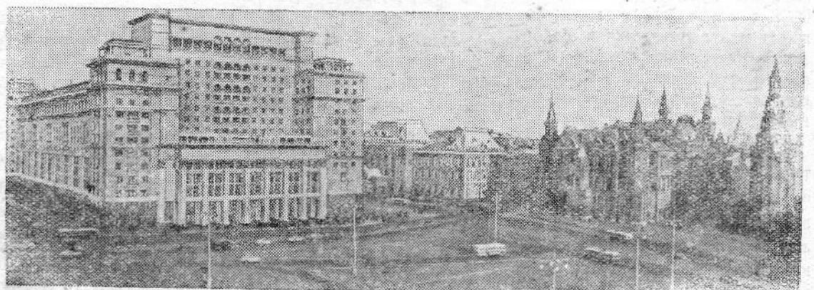
Москва сегодня. Манежная площадь. Слева—гостиница «Москва».