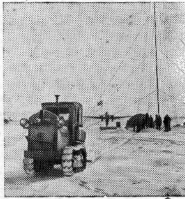
Дрейфующая научная станция на льдах Центральной Арктики.