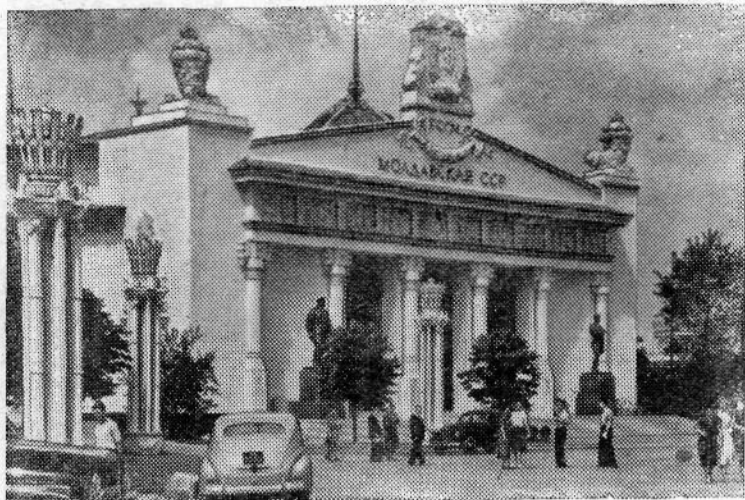
Москва. Всесоюзная сельскохозяйственная выставка. Павильон «Молдавская ССР».