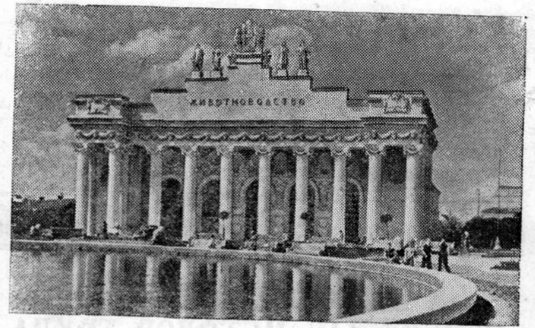
МОСКВА. Всесоюзная сельскохозяйственная выставка. Павильон «Животноводство».