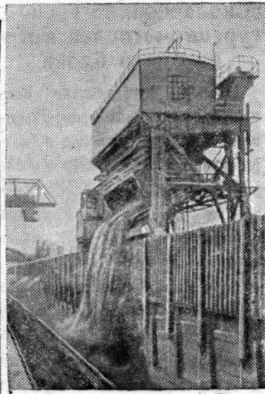
ЗАПОРОЖСКАЯ ОБЛАСТЬ. На заводе «Запорожсталь» сдан в эксплуатацию вагонопрокатыватель, сконструированный и изготовленный Южно-Уральским заводом тяжелого машиностроения. На снимке: вагонопрокатыватель.

На рынке появились ягоды: ароматная виктория и кислица.