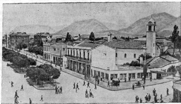
НАРОДНАЯ РЕСПУБЛИКА АЛБАНИЯ. Бульвар имени Сталина в Тиране.

денту агентства Синьхуа, что за прошедшие четыре года по китайско-советским авиалиниям было переброшено 4.700 тонн груза, а также 1.600 тонн почты и десятки тысяч пассажиров.