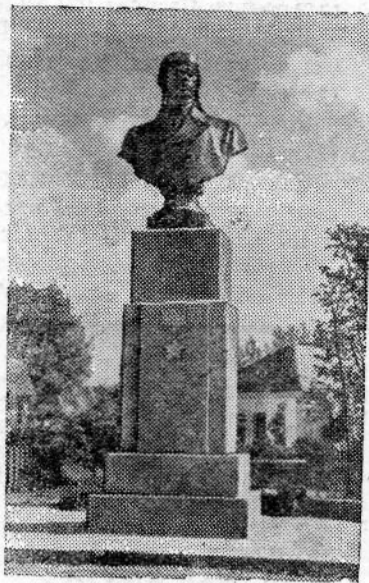
Молодечненская область. В районном центре Радошковичи установлен памятник Герою Советского Союза Н. Ф. Гастелло.