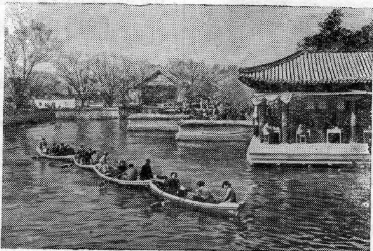
Китайская Народная Республика. Созданный в окрестностях Пекина 800 лет назад парк Ихэюань является ныне излюбленным местом отдыха трудящихся столицы. В праздники и по выходным дням десятки тысяч пекинцев устремляются в Ихэюань.

Резолюция Бюро Всемирного Совета Мира. Обращение Бюро Всемирного Совета Мира к народам Европы. «Правда», 1 апреля 1954 года.