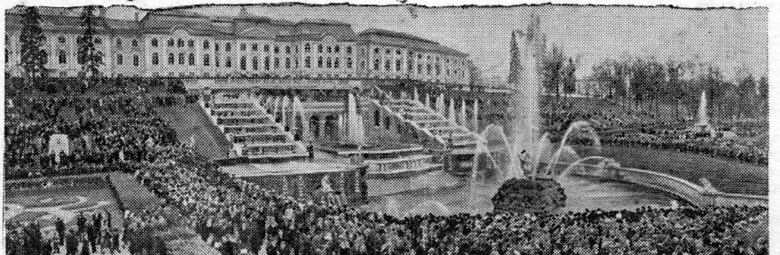
Ленинград. Народное гулянье в парке Гетродворца, посвященное открытию летнего сезона.