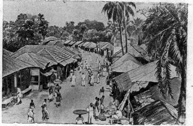
Индия. Торговая улица большой деревни в Западной Бенгалии. Деревня расположена на шоссе, ведущем из Калькутты в штат Бихар.